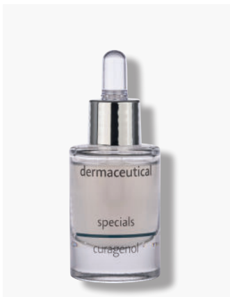
Originalverpackung 15ml Artikelnr.: 214