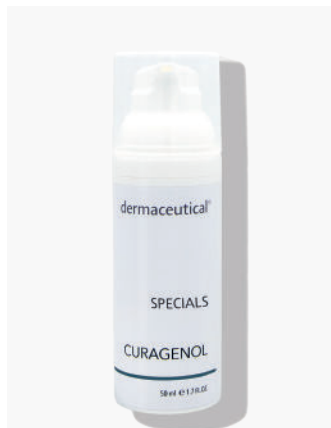
Kabinenverpackung 50ml Artikelnr.: 214P