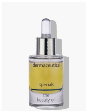
Originalverpackung 15ml Artikelnr.: 1044