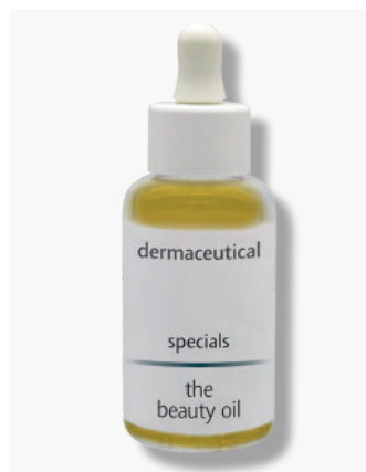
Kabinenverpackung 50ml Artikelnr.: 1044P